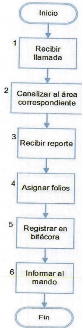
DIAGRAMA DE FLUJO: Procedimiento para recepción y atención de auxilios.