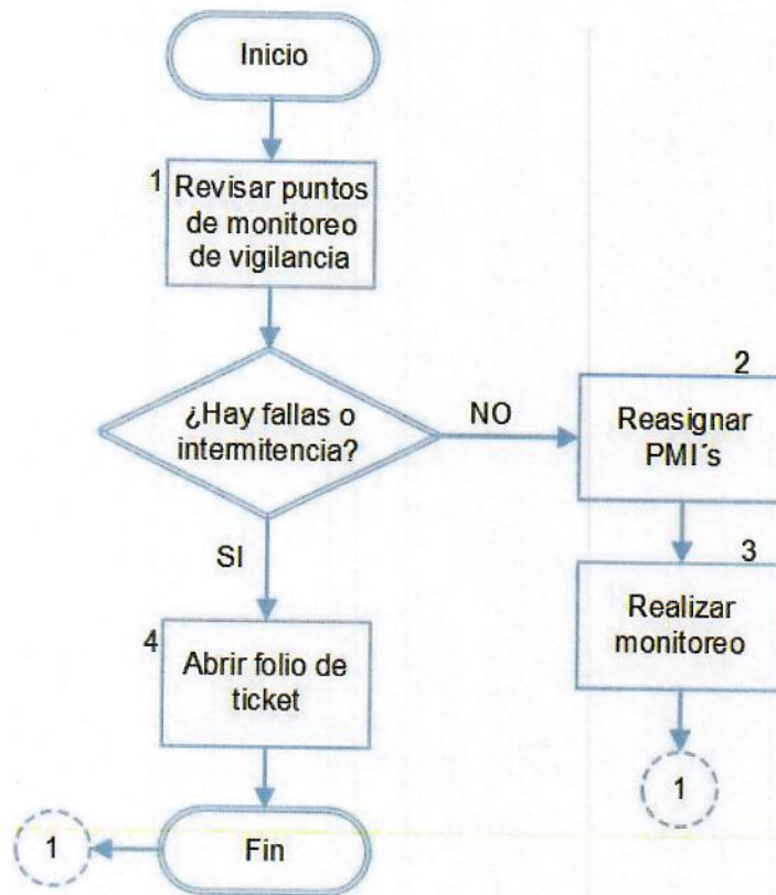
DIAGRAMA DE FLUJO: Procedimiento para monitoreo de cámaras de vigilancia.